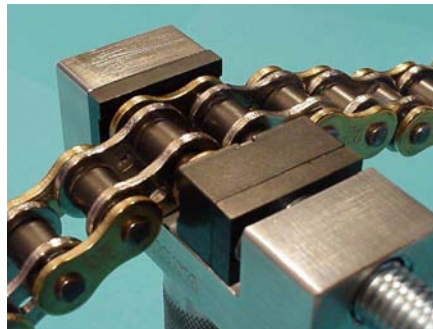
ENUMA Kettenlaschenzentrierwerkzeug zum gleichmäßigen Aufpressen der Laschen (nicht zum Vernieten geeignet!)