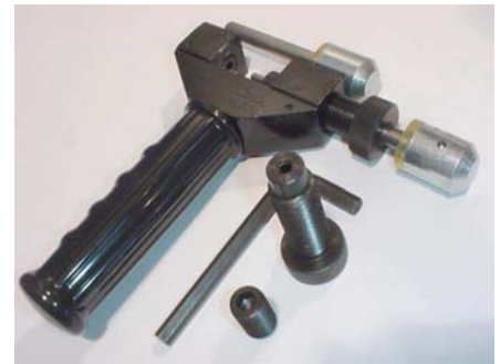
WHALE Kettenwerkzeug Trennen und Vernieten mit einem Werkzeug, auch an der Maschine

Bitte immer auf korrekte Kettenspannung achten: