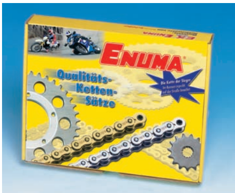
Kettensatz in attraktiver Verpackung

Bitte immer auf korrekte Kettenspannung achten: